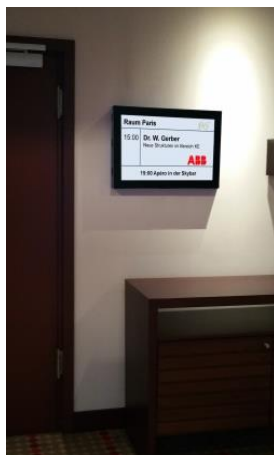
H-Type 23" an die Wand montiert