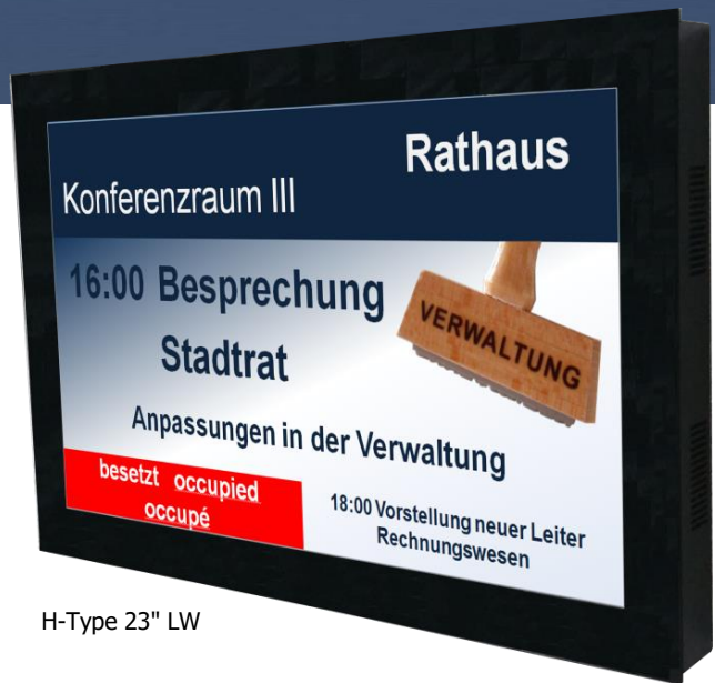
H-Type 23" LW

multitech entwickelt elektronische Informations- und Anzeigesysteme in den verschiedensten Ausführungen. Die Kombination zwischen Funktionalität, qualitativ hochstehender Elektronik und Design sind die herausragenden Attribute dieser Anlagen. Als Basis dafür wurde der H-Type entwickelt. Dieses modulare Anzeigesystem verfügt über alle Eigenschaften, die heute an die Hardware einer Digital Signage Anlage gestellt werden. Der H-Type ist eine elegante Erscheinung, verfügt trotzdem über die notwendige Robustheit und wurde für den Dauereinsatz ausgelegt. Die Kabelführung ist verdeckt und die Digital Signage Player können in das Gehäuse integriert werden. Die Geräte sind in den verschiedensten Größen, sowohl als Wandmodelle, wie auch als freistehende Säulen erhältlich und können auf fast alle Bedürfnisse angepasst werden.