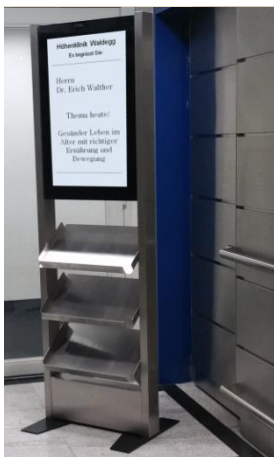
H-Type 32" Portrait-Format mit Ablagen