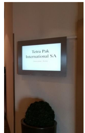
Kundenspezifisches Gerät 32" in Edelstahl