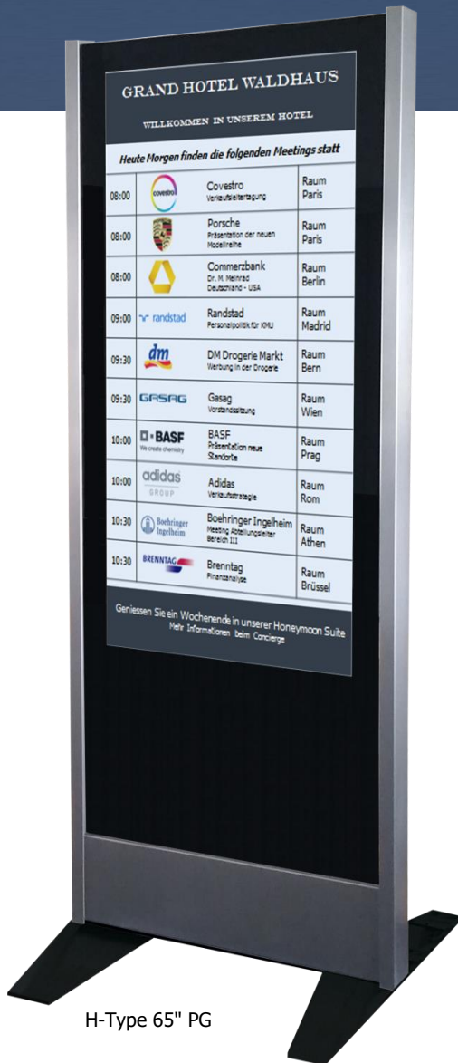
H-Type 65" PG