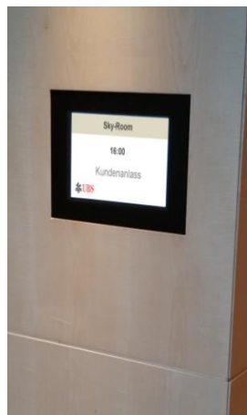
H-Type 15" in die Wand eingelassen