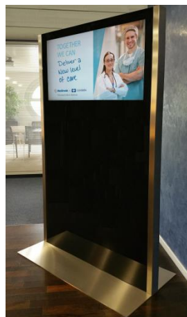
H-Type 49" Landscape-Format mit Glasfüllung