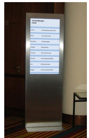
Kundenspezifisches Gerät 49" in Edelstahl