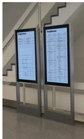
H-Type 55" Portrait-Format ohne Füllung