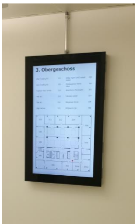
H-Type 49" an die Wand montiert

Bildschirme für Wandmontage im Empfangsbereich und vor Konferenz- und Sitzungsräumen